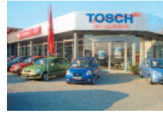
Luckau, Berliner Str. 17 Tel.: 0 35 44 / 55 59 20