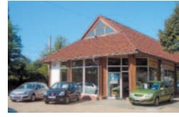
Lübben, Bahnhofstr. 22 Tel.: 0 35 46 / 22 59 20